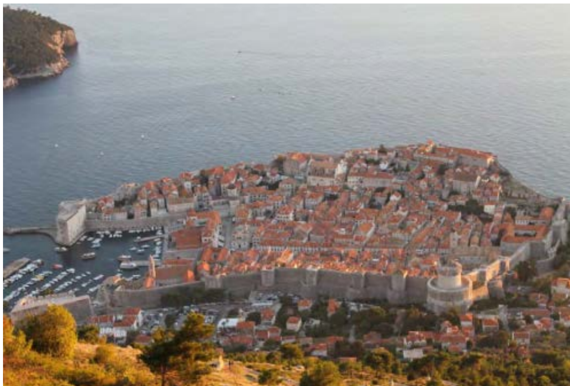
Stari Grad Dubrovnik